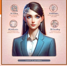
■ AIキャラクターがご案内